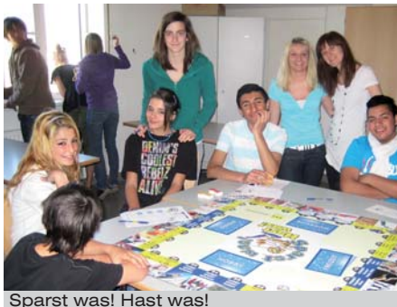
Sparst was! Hast was!